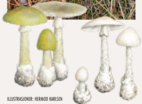
ILLUSTRASJONER: HERMOD KARLSEN