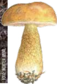
ILLUSTRASJONER: HERMOD KARLSEN

Gallerørsopp er en forvekslingsart til steinsoppen. Den er ikke giftig, men med sin veldig beske smak er den ikke god. I motsetning til steinsoppene har den grovt, brunt årenett på stilken og rørlag som blir rosa med alder. Hvis du har en ung sopp som fortsatt har hvitt rørlag, kan du legge tungen mot rørlaget for å smake om det er beskt.