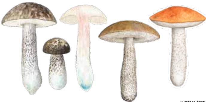
ILLUSTRASJONER: HERMOD KARLSEN